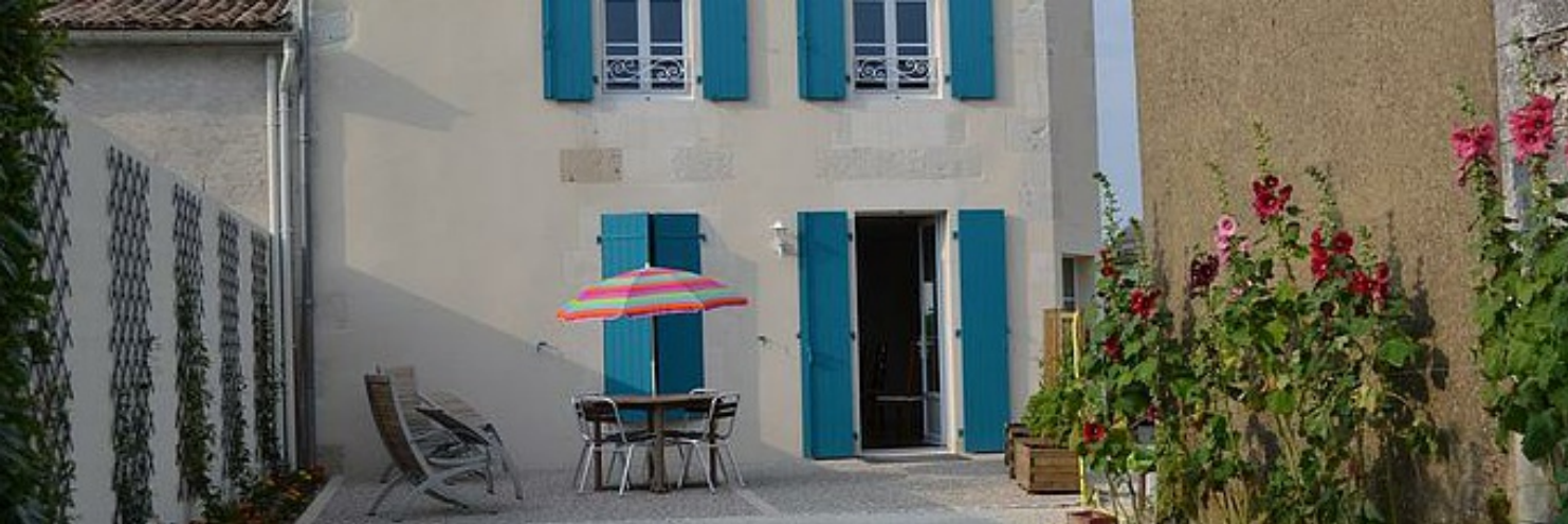
Gîte du Chai - Gîte adapté tous handicaps - Royan Atlantique